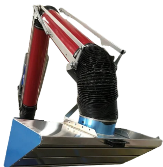
Hotte MAXIRET sur bras de 200mm