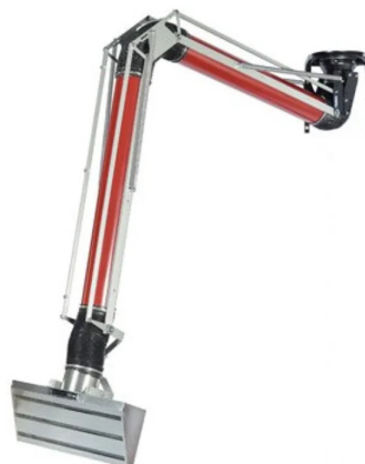
Hotte MAXIRET sur bras sans aspirateur