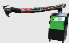
Aspiratore fumi MFUHCO MFU21HCO0000000

Aspiratore fumi di saldatura da parete WFU18 filtrazione efficienza H13 99,99%.