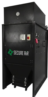
Box insonorizzato e filtro HEPA