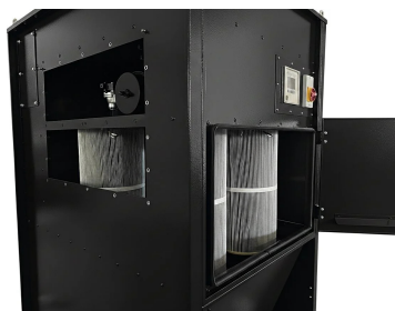
Accesso frontale e laterale alle cartucce. Porta ispezione vano serbatoio.