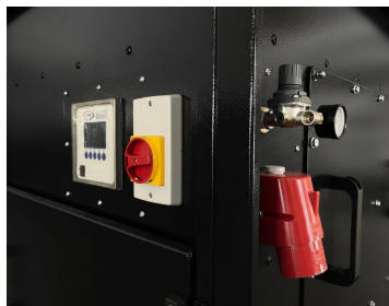
Display LCD e interruttore. Spina e attacco aria compressa